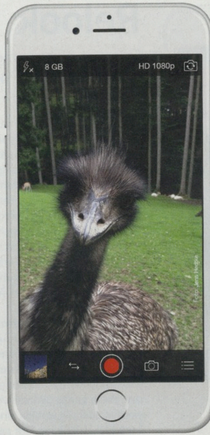
Natürlich verfügt ProCamera auch über einen HD-Videomodus

es können sogar Objekte in Bewegung fotografiert werden. Je nach Geschmack können nicht nur ganz natürliche, sondern auch lebhaft-dramatische Resultate erzielt werden.