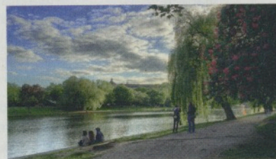
Die vividHDR-Technologie ermöglicht Fotos mit hohem Dynamikumfang

✓ Gehen Sie auf Entdeckungsreise mit dem innovativen Photo Compass: Dank der Geodaten, die in Ihren iPhone-Fotos enthalten sind, kann Sie ProCamera zurückführen zu Ihren liebsten Foto-Locations. Entdecken Sie Fotomotive ganz neu – auch ohne Internetverbindung!