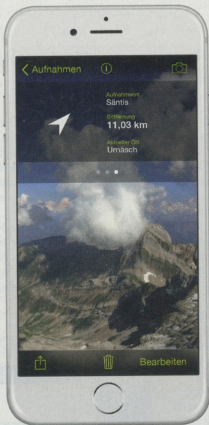
Der Fotokompass führt Sie direkt zum Aufnahmeort eines Fotos