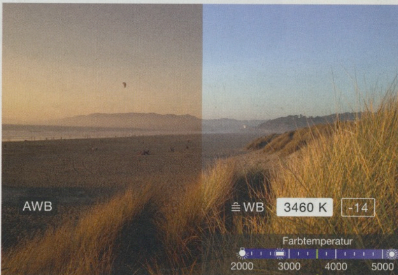
Mit ProCamera haben Sie dank manuell einstellbarem Weißabgleich und Belichtungseinstellungen jede Lichtsituation im Griff

Vor jedem Urlaub das gleiche Lied: Wie kleinere ich das Reisegepäck? Was muss wirklich mit? Zumindest bei der Kameraausrüstung kann in den letzten Jahren gespart werden. Das iPhone ist sowieso dabei. Die Bildqualität der dort verbauten Kamera genügt mittlerweile gehobenen Ansprüchen. Ein Vorteil im Vergleich zu Kompakt- und Spiegelreflex-Kameras: Beim iPhone kann die Bedienungssoftware selbst gewählt werden. Außerdem können die Bilder nicht nur betrachtet, sondern auch bearbeitet und verschickt werden. Mit ProCamera sind Sie auch für kritischere Lichtsituationen gewappnet, denn das sind oft die schönsten Urlaubsmomente: Flirrendes Gegenlicht am Strand, Postkartenreife Sonnenuntergänge, interessante Kleinigkeiten am Wegesrand, Selbstporträts vor spektakulären Sehenswürdigkeiten, spielende Kinder und der laue Abend mit Freunden.