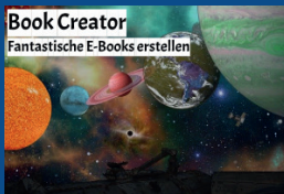
Book Creator Fantastische E-Books erstellen