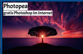
Photopea gratis Photoshop im Internet