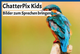
ChatterPix Kids Bilder zum Sprechen bringen