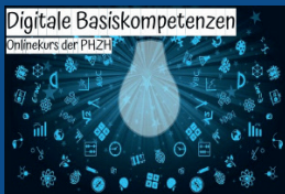
Digitale Basiskompetenzen Onlinekurs der PHZH