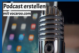
Podcast erstellen mit vocaroo.com