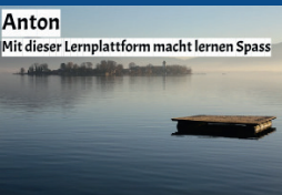
Anton Mit dieser Lernplattform macht lernen Spass